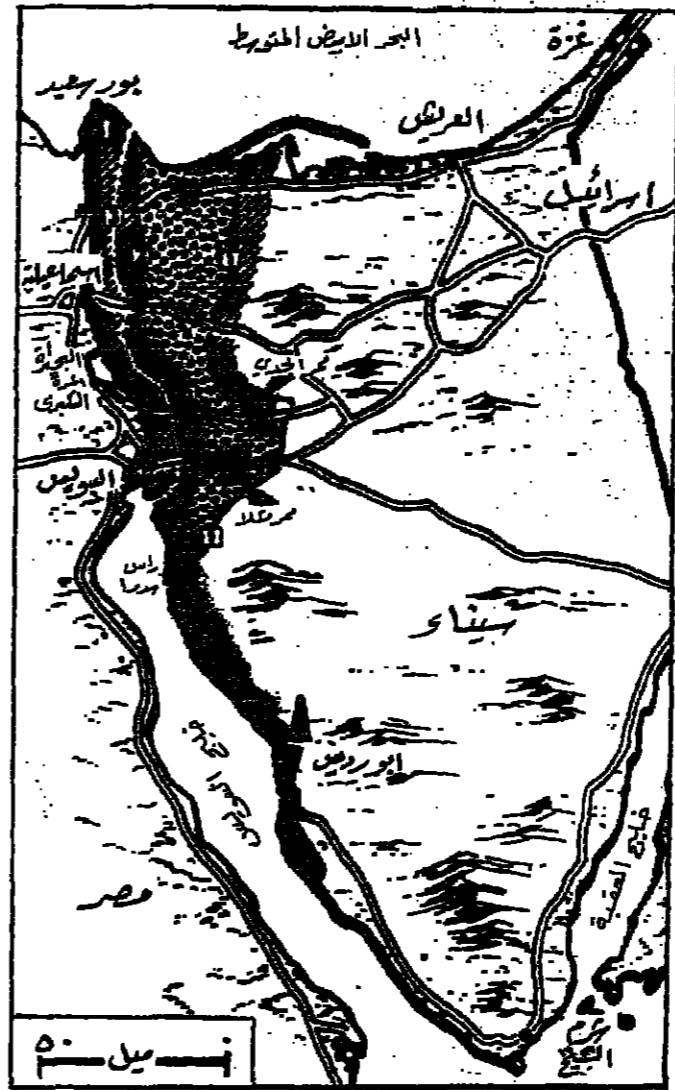
خريطة اتفاق الفصل بين القوات بين سيناء